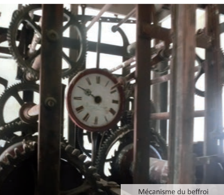
Mécanisme du beffroi

Le projet de cette construction aboutit en 1756. Les travaux vont durer une année environ. Auparavant, le rythme journalier était établi par le son de la cloche de l'église annonçant les trois temps de l'Angélus : matin, midi et soir. Pour le réglage de l'horloge, un escalier étroit permet d'atteindre le premier étage. Un homme d'entretien est nommé pour remonter, régler et huiler le mécanisme. Ce beffroi possède un magnifique campanile en fer forgé, typique de l'architecture méridionale. Il est inscrit aux monuments historiques depuis 1934.