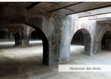
Réservoir des Aires

Difficulté: Aucune (sauf escaliers) - Peu adapté aux PMR