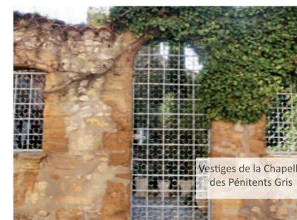
Vestiges de la Chapelle des Pénitents Gris