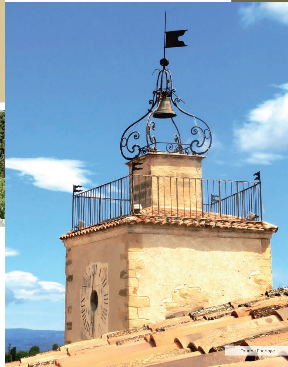
Tour de l'horloge