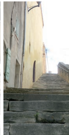
Montée du Barri