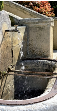
Fontaine, au bas de l'église