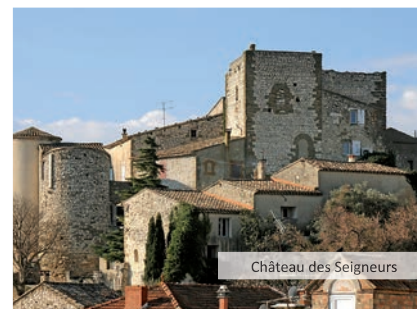
Château des Seigneurs